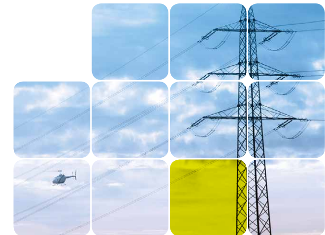
Die Syna sorgt zuverlässig für ein hohes Maß an Versorgungsqualität. Dazu trägt die jährliche Kontrolle per Hubschrauber aus der Luft bei.